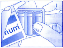
1 - Sortir la barquette de 3 doses de l'étui.